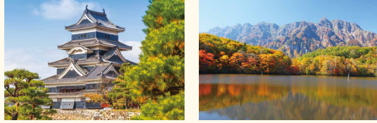
① Matsumoto Castle ② Kamikochi

หากท่านอยากสนุกสนานกับญี่ปุ่นตะวันออกอย่างเต็มที่ ขอแนะนำพื้นที่ Nagano, Niigata พื้นที่บริเวณใกล้เคียงจาก Tokyo สามารถเพลิดเพลินไปกับทิวทัศน์สวยงาม และยังมีออนเซ็นกับลานสกีซึ่งสนุกสนานได้ ทำให้สามารถท่องเที่ยวได้ทุกรูปแบบ