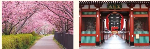
⑦ Izu ⑧ Tokyo (Senso-ji)