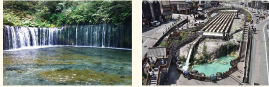
⑤ Karuizawa ⑥ Kusatsu